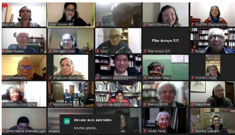
Agentes pastorales se reúnen en 51º Curso de Teología dirigido por el IBC