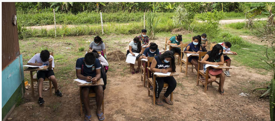
La pandemia dejó al descubierto la falencia del sistema educativo y de salud en los pueblos aledaños que la red rural acompaña hace más de 13 años, así como también la falta de los servicios básicos de agua y desagüe, electricidad, conectividad a internet y esto se suma a la falta de alimentos de primera necesidad.