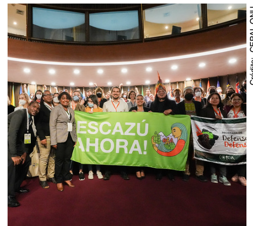
Primera reunión de la Conferencia de las Partes (COP 1) del Acuerdo Regional de Escazú.